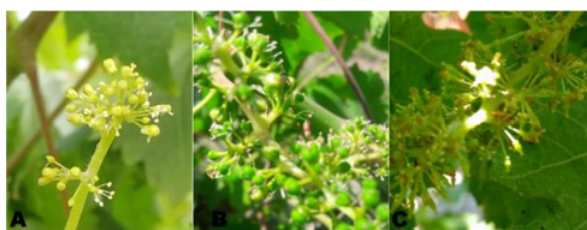
Figura 1. Órganos sexuales de flores de las accesiones de vid denominadas “Italia”: (A) Italia, (B) Italia Dorada, (C) Italia Rosada.

Rosada mostró bayas de tamaño medianas y forma variable como esferoides y obovoides.