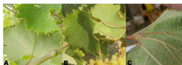
Figura 3. Hojas adultas de las accesiones de vid denominadas “Italia”: (A) Italia, (B) Italia Dorada, (C) Italia Rosada.

esta variedad podría haber sido introducida a Perú a comienzos del siglo XVII [4] y luego fue difundida a Chile y Argentina donde generalmente se la haya cultivada con Moscatel de Alejandría [26]. En Argentina, se la clasifica como una variedad “criolla” sudamericana ya que habiéndose perdido su conexión con los parentales europeos, se la considera un cepaje local [6, 27]. Sin embargo este tipo de especulaciones están sujetos a comprobación. Actualmente Italia Rosada posee una reducida extensión en el valle de Ica y es muy poco utilizada en la producción de Pisco aunque ofrece un perfil aromático importante, con aromas florales y frutales [28].